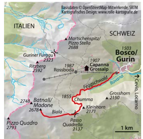
© alpinwelt 3/2019, Text & Foto: Siegfried Garmwälder

steile Wiesen der Südostrücken des Batnall/Madone erreicht wird. Von dort steil an einem markanten Felszacken rechts vorbei und über raue, griffige Gesteinsplatten zu unserem Ziel, dem Punkt 2678, hinauf. Der Abstieg verläuft entlang der Aufstiegsroute.