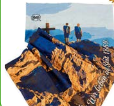
Jubiläums-Buff ab 15,95 €