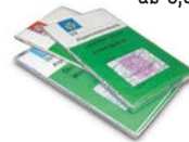
AV-Karten ab 6,95 €