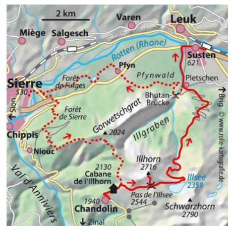
© alpinwelt 3/2019, Text & Foto: Patrick Brauns

de Chandolin aufsteigen (↗ ↘ gut 11 Std., ca. 2190 Hm). Statt nach Susten absteigen, kann man auch über die „Bhutanbrücke“ in den Pfywald gehen und kommt durch den Forêt de Finges zurück nach Sierre (etwa 1,5 Std. mehr).