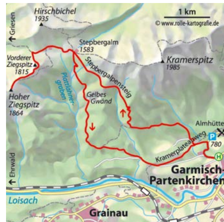
© alpinwelt 3/2019, Text: Gottilind Bleichschmidt, Foto: Joachim Burghardt

Gipfelplateau. Zurück bei der Stepbergalm, ist der Abstieg durch das „Gelbe Gwänd“ eine spannende Option. Hierzu geht man bei der Alm steiler nach Süden neben dem Plattlahnergraben hinunter, passiert auf einem Treppenweg (Drahtseile, nicht bei Regen!) eine Erosionsschlucht und die Felswände des Gelben Gwänd und kommt im Wald zügig tiefer. Man erreicht eine Forststraße und folgt dieser über 1,5 Kilometer, biegt schräg links auf den Kramerplateauweg ab und kehrt zum Parkplatz bzw. zur Bushaltestelle zurück.