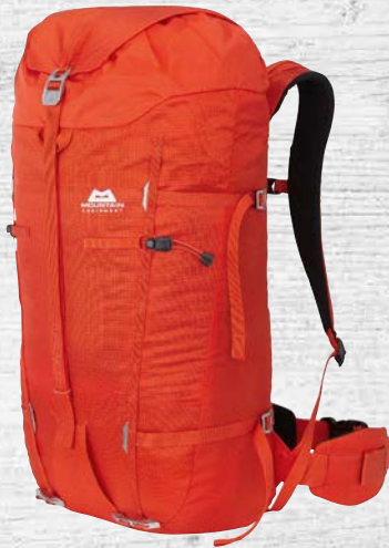
z. B. Rucksack ab 2,50 €/Tag

Das richtige Zubehör für eine gelungene Tour erhältlich in unserem