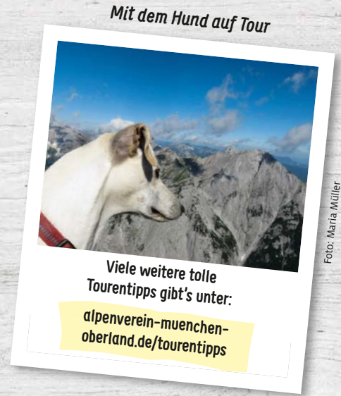
Mit dem Hund auf Tour

Was kann es Schöneres geben, als zusammen mit dem besten Freund des Menschen – dem Hund – in den Bergen unterwegs zu sein? Eine schöne aussichtsreiche Tour am Achensee führt von der Gramai Alm im Falzthurtal zur Lamsenjochhütte. Von dort geht es über das Westliche Lamsenjoch weiter zum Binsattel, mutige Vierbeiner wählen den Weg über die Hahnkampfl-Spitze. Vom Binsattel wandern wir über den Gramai Alm-Hochleger wieder zurück zum Ausgangspunkt.