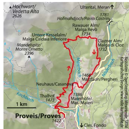
© alpinwelt 3/2019, Text & Foto: Franziska Baumann

straße und zweigt nach einer S-Kurve links auf einen Wiesenweg ab. Bei den Neuhaus-Höfen überquert man den Maierbach und gelangt talauswärts zur Straße nach Proveis. Im Tal des Kirchbachs kommt man rechts wieder zum Erlebnisweg und zurück nach Proveis.