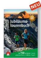
DAV Jubiläumstourenbuch 14,90 €

Servicestelle am Marienplatz * im Sporthaus Schuster Rosenstraße 1–5, 4. OG, 80331 München, Tel. +49 89 551700-0 service@alpenverein-muenchen.de alpenverein-muenchen-oberland.de/marienplatz