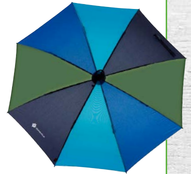
Trekkingsschirm ab 45,90 €