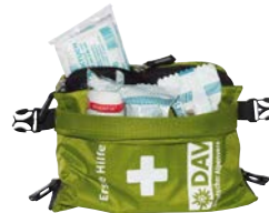
Erste-Hilfe-Set ab 26,95 €