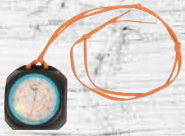
z. B. Höhenmesser ab 2,50 €/Tag

TIPP: Hochwertiges Touren-Equipment ausleihen und testen!