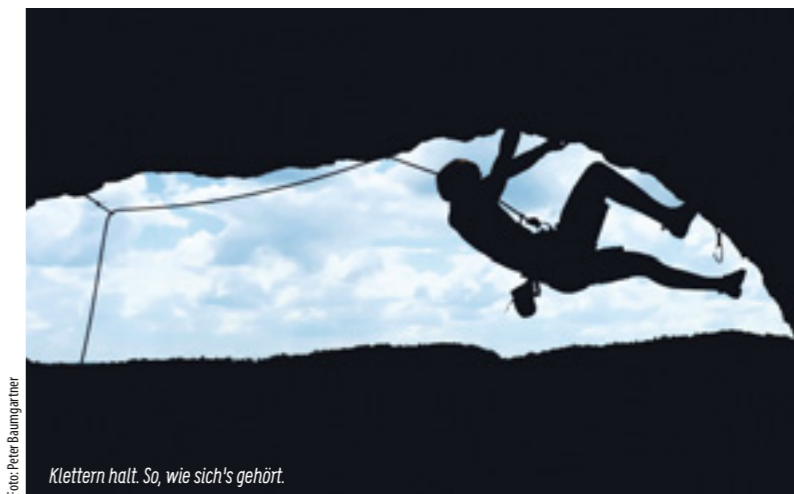
Klettern halt. So, wie sich's gehört.

zen selbst einbringt. Jedes JUMA-Jahr startet mit einem Planungstreffen im Herbst, bei dem an einem gemütlichen Abend ein vielseitiges Programm für das folgende Jahr erstellt wird. Auch die inhaltliche Gestaltung unserer ca. einmal im Monat stattfindenden Themenabende liegt ganz bei euch. So können wir gemeinsam viele schöne Touren, Abenteuer und Abende erleben.