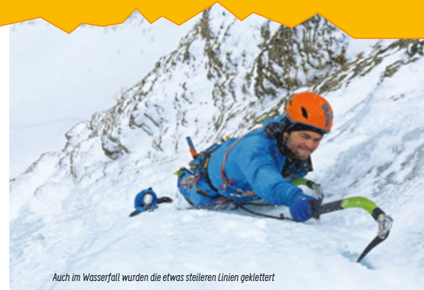
Auch im Wasserfall wurden die etwas steileren Linien geklettert