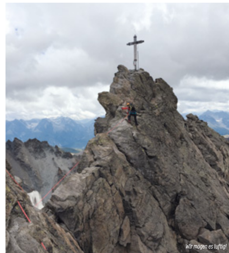
Wir mögen es luftig!

Was fest steht ist, dass es in der JUMA äußerst selten langweilig ist.