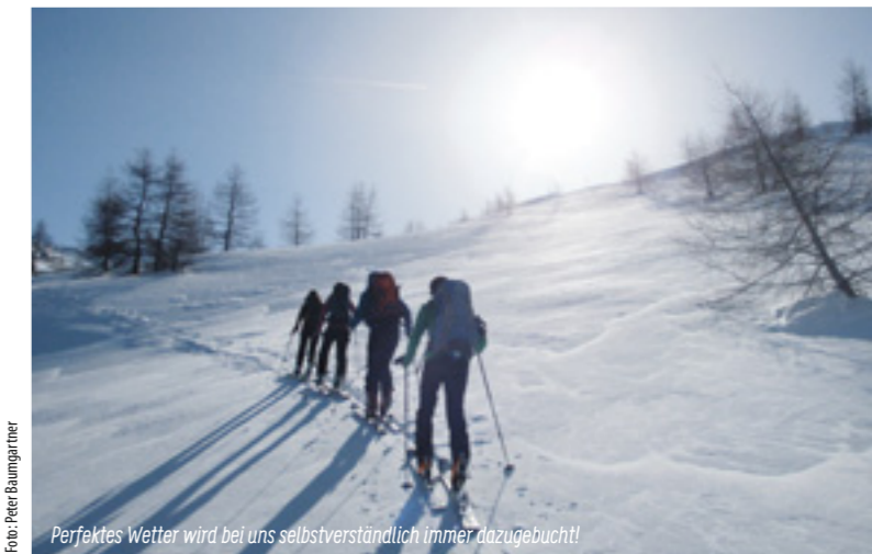
Perfektes Wetter wird bei uns selbstverständlich immer dazugebucht!