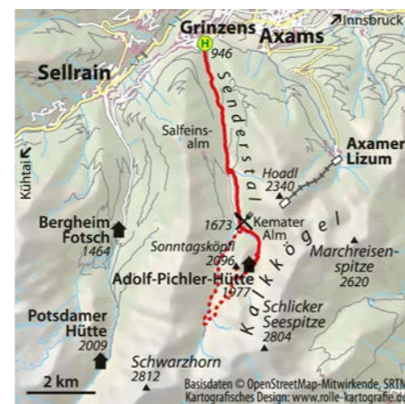
© alpinwelt 2/2020, Text & Foto: Michael Reimer

zur Salfeinsalm erstmals freie Almflächen. Hier verlassen wir den Fahrweg in östliche Richtung und stoßen nach kurzem Anstieg auf den beschildderten Wiesenweg in Richtung Kemater Alm. Die imposanten Kalkkögel, die aufgrund ihrer schroffen Gipfel auch als die „Dolomiten Nordtirols“ bezeichnet werden, rücken nun immer eindrucksvoller in unser Blickfeld. Oberhalb des großen Wanderparkplatzes an der Kemater Alm führt der bequeme Fahrweg – nur der Schlussanstieg ist etwas steiler – entlang des Griesbachs in knapp einer Stunde zur Adolf-Pichler-Hütte. Die Tourenmöglichkeiten rund um die Hütte sind viel-