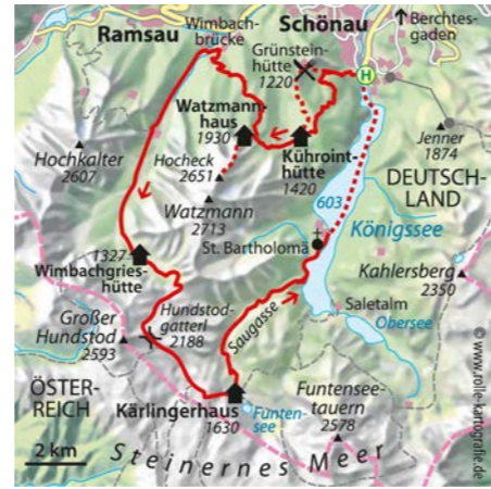
© alpinwelt 2/2020, Text: Redaktion alpinwelt

Tag 3: Von der Wimbachgrieshütte wandern wir das Wimbachgries bis zum Talschluss aus, dann führt unser Steig zunehmend steil zur verfallenen Trisch-übelalm hinauf. Nach weiterem Anstieg geht es ein Stück zur Quelle unter dem Graskopf hinab, bevor die Route über das zerklüftete Gestein der Hundstodgrube zum Hundstodgatterl (2188 m) hinaufführt. Wer das Hoheck nicht bestiegen hat, steht hier am höchsten Punkt des viertägigen Hüttentrekking. Richtung Süden öffnet sich das Steinerne Meer mit Blick auf die auffallend spitz zulaufende Schönfeldspitze. Statt auf das weithin sichtbare Ingolstädter Haus zuzuwandern, halten wir uns im Abstieg links und durchqueren in stetem Auf und Ab die unteren Ausläufer des verkarsteten Steinernen Meeres südostwärts. Dann bricht das Karstgelände ab, und wir tauchen in von Bachläufen geprägtes Wald- und Wiesengelände ein. Mit Erreichen des grünen Hochplateaus mit seinen wenig scheuen Murmeltieren ist es dann nur noch ein Katzensprung bis zum Kärlingerhaus (1630 m).