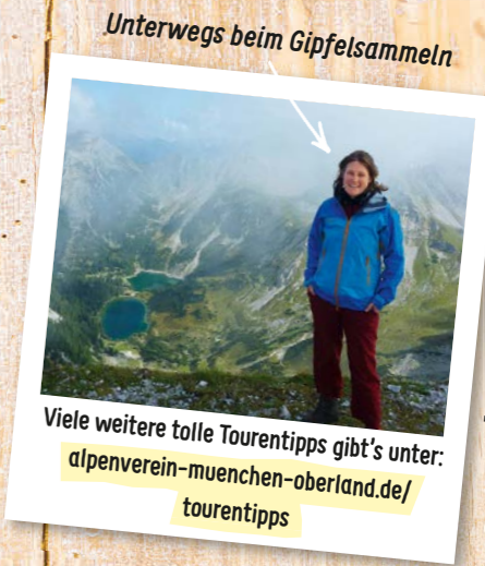
Unterwegs beim Gipfelsammeln

Eine Gipfelrunde der Extraklasse: Mit einer umweltfreundlichen Bahn- und Busanreise erschließt sich von Krün aus eine fordernde, landschaftlich sehr reizvolle Tour mit der Soiernspitze als Höhepunkt von sieben Gipfeln. Mit einer Übernachtung auf dem Soiernhaus lässt sich die Tour auch gut auf ein Wochenende ausweiten. Highlight der Runde sind die wunderschönen Blicke ins Karwendel und auf die glasklaren Soiernseen, die schon König Ludwig II. zu schätzen wusste.