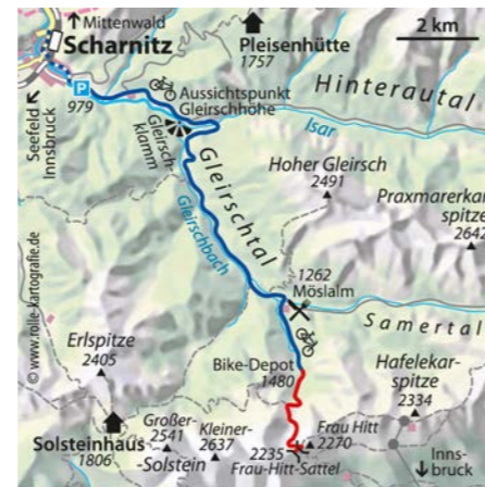
© alpinwelt 2/2020, Text: Michael Reimer, Foto: Mariozot bei Wikimedia Commons, Lizenz CC BY 3.0

Weiter geht es zu Fuß mäßig steil durch die Latschenzone aufwärts. Nach der ersten Steilstufe mündet der vom benachbarten Großkristental herführende „Gipfelstürmerweg“ in unsere Route ein. Im oberen Kar windet sich der Pfad steil erst über Schuttfelder, dann entlang der teils mit Drahtseilen gesicherten Felsen empör; der in einer Senke auftauchende kleine Bergsee trocknet in niederschlagsarmen Jahren aus. Unser