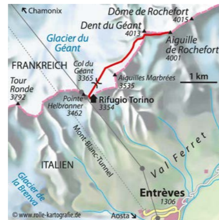
© alpinwelt 2/2020, Text & Foto: Gotlind Bleichschmidt

sowie kurzen Felspassagen auf. Die Schlüsselstelle folgt nach P. 3933 m mit einer seilversicherten, ca. 50° steilen Rinne hinab zu einem Joch (evtl. abseilen). Nach einigen Felstürmen endet der Rochefortgrat und geht in die brüchige Südwestflanke (3–4 Seillängen) der Aiguille de Rochefort über. Hier hält man sich rechts zu einer Rinne mit eingerichteten Standplätzen, über die man zum Gipfel kommt (2–2,5 Std.). Abstieg wie Aufstieg, mit Abseilen von der Aiguille hinunter.