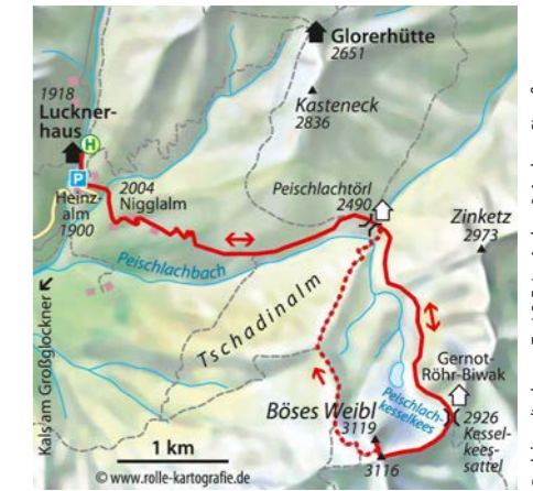
© alpinwelt 2/2020, Text & Foto: Andrea & Andreas Strauß

flacheres Blockfeld auf den Vorgipfel (3116 m). Hier knickt der Grat nach Nordwesten bzw. nach Norden ab und führt ohne Höhengewinn zum Gipfel hinüber. Für die Passage oberhalb des Sattels ist Trittsicherheit nötig.