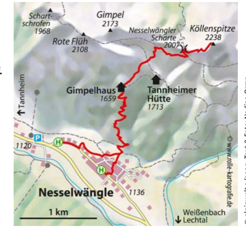
© alpinwelt 2/2020, Text & Foto: Nadine Ormo

Steinen zu vermeiden. Auf dem Gimpelhaus bietet sich eine Übernachtung an, um am nächsten Tag zum Beispiel eine Tour über die Rote Flüh und den Friedberger Klettersteig anzuschließen.